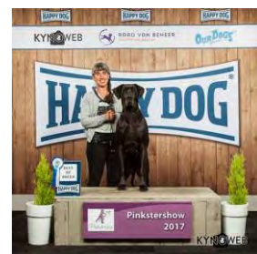
XSally Wasa Perasperaadastra