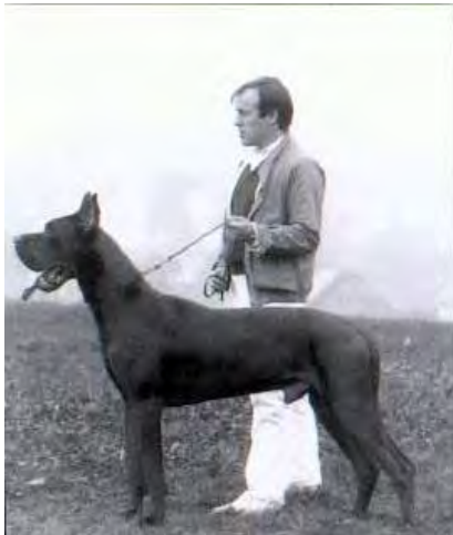
Zorro Perasparaadastra Internationaler Champion

Wir führten unsere Blauzucht immer gezielter in eine Schwarzzucht. Einerseits weil die Auswahl an guten Hunden grösser war und andererseits unsere Zucht für schwarze Doggen immer bekannter wurde.