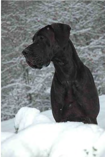
Xelana Perasperaadastra Russlandsiegerin

Xenox, Xeni, Xavier-James, Xarat, Xanto, Xelana, Xenia-Avia, X-Sally, X-Khaleesi.