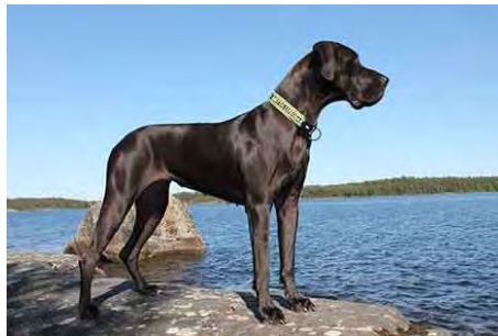
Gewünschtes Zuchtziel X-Sally Wasa Perasparaadastra, schwarz, mehrmals erste Preise im In- und Ausland.

Unser Zuchtziel war und ist immer das gleiche: Eine gesunde, wesensfeste und möglichst langlebige Deutsche Dogge zu züchten. Sie sollte von eleganter, muskulöser Erscheinung sein, einen fein gemeißelten Kopf haben, mit deutlichem aber nicht übertriebenem Stirnabsatz, korrekt und gesund geformten Augen, mit kantiger aber knapper Belegung, der Nasenrücken eher breit und der Oberkopf eher schmal, flach und parallel zum Nasenrücken verlaufend. Einen unbedingt trockenen und geschwungenen Hals zeigen, einen festen geraden Rücken aufweisen, gut proportionierte Brustpartien haben, eine schön aufgezoogene Bauchlinie präsentieren und auf massvoll gewinkelten und geraden Läufen stehen. Die Bewegung muss fließend und frei sein. Das Wesen freundlich, stabil, anhänglich und ruhig. Sie sollte sich stressfrei und problemlos sozialisieren lassen. Die Farbe möglichst pigmentvoll, das heisst für mich in schwarz. Auch rein optisch steht für mich Schwarz bei einer Deutschen Dogge an erster Stelle.