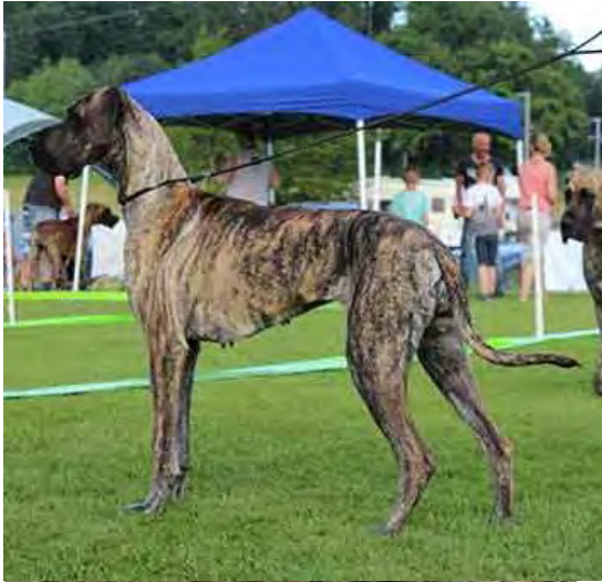
Zofia Eringa Perasperaadastra Retro-Typus mit «Blutanschluss» der Eltern in den dreissiger Jahren