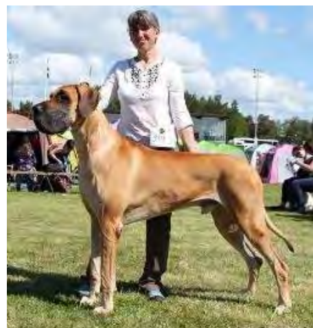
Captain America vom Wasaland Internationaler Champion