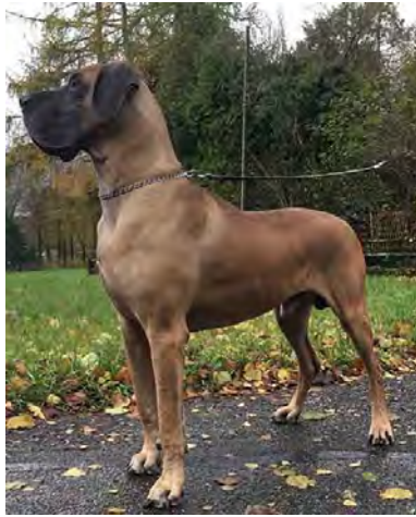
Ben Espera vom Wasaland Schweizer Sieger